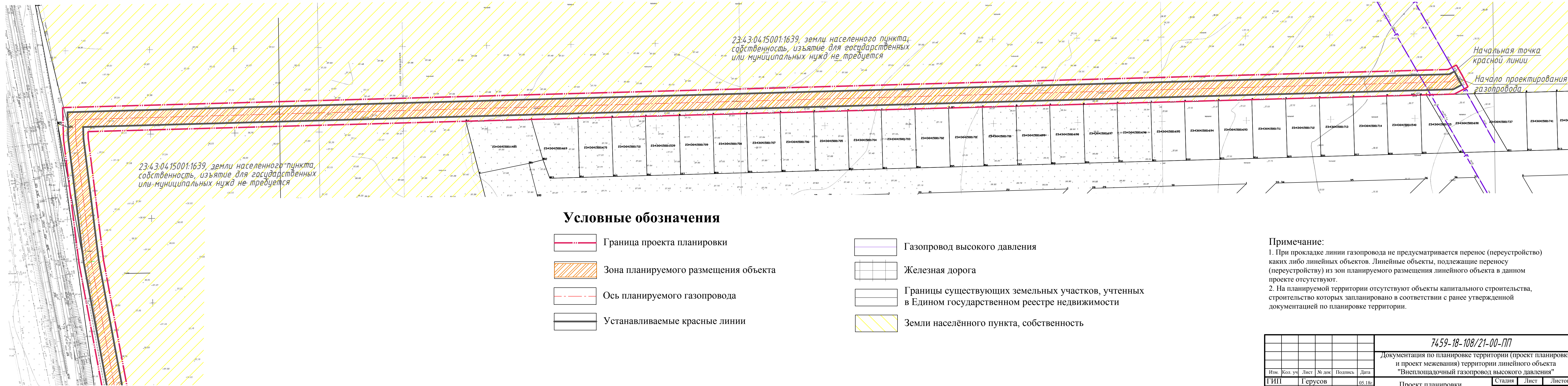
Линия совмещения с листом 2